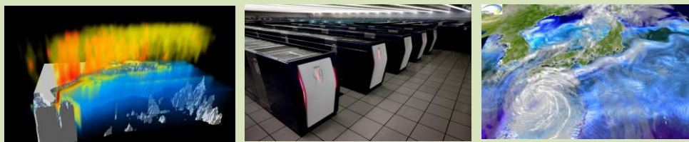
〒236-0001 神奈川県横浜市金沢区昭和町 3173-25 横浜研究所

横浜研究所 は、世界最高性能レベルのスーパーコンピュータ「 地球シミュレータ 」を駆使し、地球環境予測研究、地球内部ダイナミクス研究などのシミュレーションの研究開発を進めています。さらに、地球環境情報に関するデータセンターの役割を担い、JAMSTEC における研究・観測活動で得られた様々なデータを集約、電子情報として管理し、最新の研究成果を広く一般に提供できるシステムを構築しています。 ツアーでは地球環境情報に関する展示施設や「地球シミュレータ」の見学が出来ます。