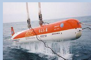
〒神奈川県横須賀市夏島町1-25 海洋研究開発機構(横須賀本部)